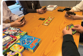
▲ 珍しいゲームもたくさん。ゲームの会